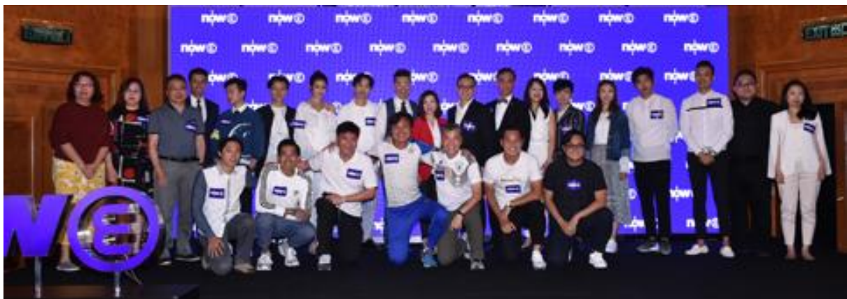
Now E 服務啟動儀式。